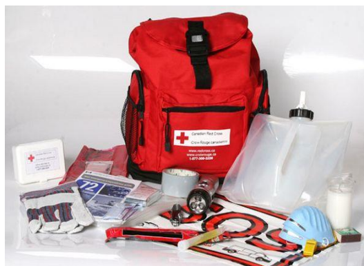
Trousse de la Croix-Rouge canadienne

Les 7 premiers articles vous permettront, à vous et à votre famille, de subsister pendant les 3 premiers jours d'une situation d'urgence, le temps qu'arrivent les secours ou que les services essentiels soient rétablis.