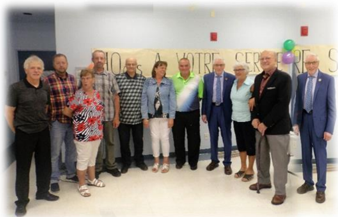
(Quelques anciens administrateurs)